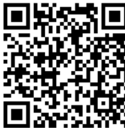
QR-code collecte onderhoud